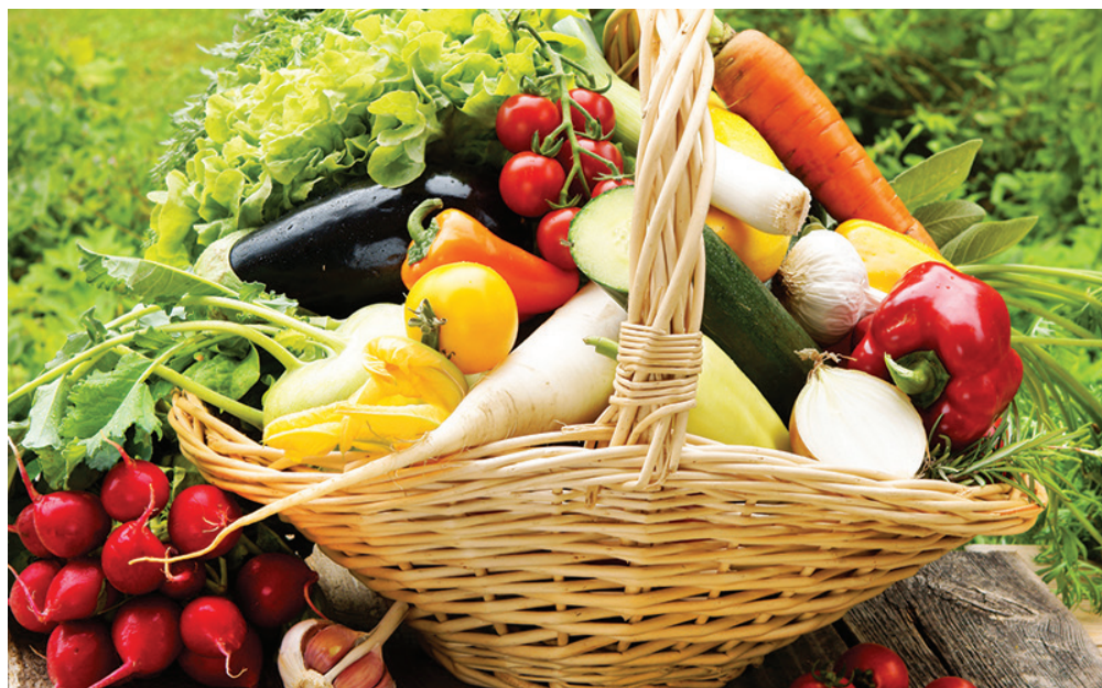
Version octobre 2016